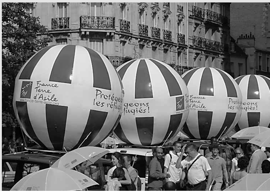
Eine Aktion von France Tene d'Asile

Das BVerwG hat die Revisionen des Landes Berlin gegen Entscheidungen des OVG Berlin zurückgewiesen. Zur Begründung hat es auf eine Entscheidung des BVerfG vom Mai 2006 abgestellt. Danach besteht eine ausreichende Rechtsgrundlage für die Rücknahme durch Täuschung erschlichener Einbürgerungen in Anwendung des VwVfG, wenn die Ein-