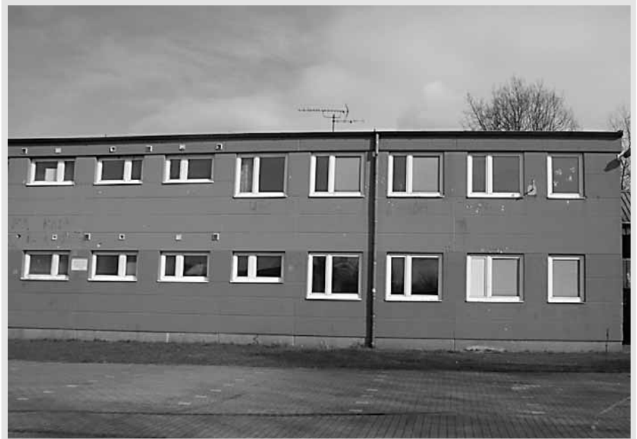
Die Unterkunft in der Grimberstraße in Essen-Kray

wir hatten mit vier Personen nur einen Raum, wo geschlafen, gekocht und gegessen wurde. Dort gab es Gemeinschaftsduschen und -toiletten, die nie sauber waren, weil dort geraucht wurde und keiner auf Sau-