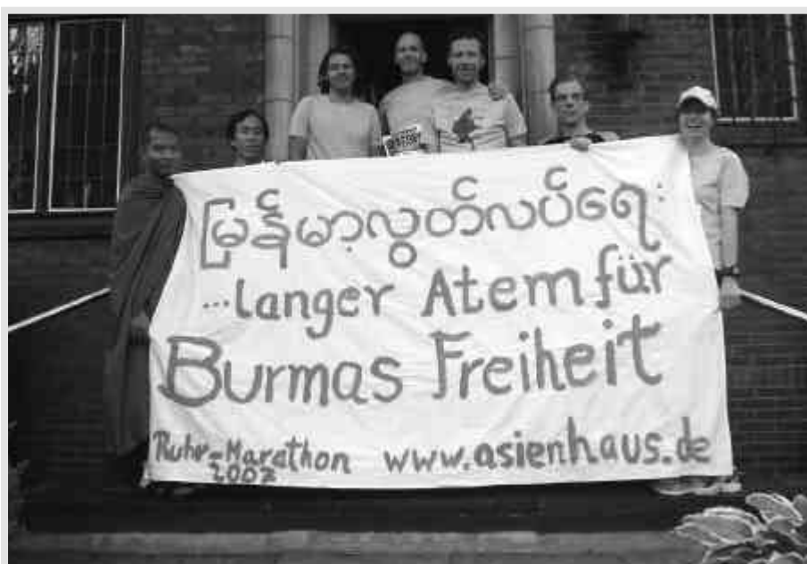
Die Burma-Läufer am Ziel

Nach langer Diskussion hatten die Innenminister im November 2006 ein Bleiberecht beschlossen. Es sollte