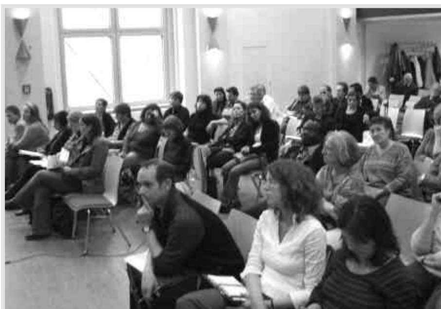
Ein Blick ins Publikum

taz NRW Nr. 8287 vom 31.5.2007, Seite 1, 25 Kommentar Natalie Wiesmann